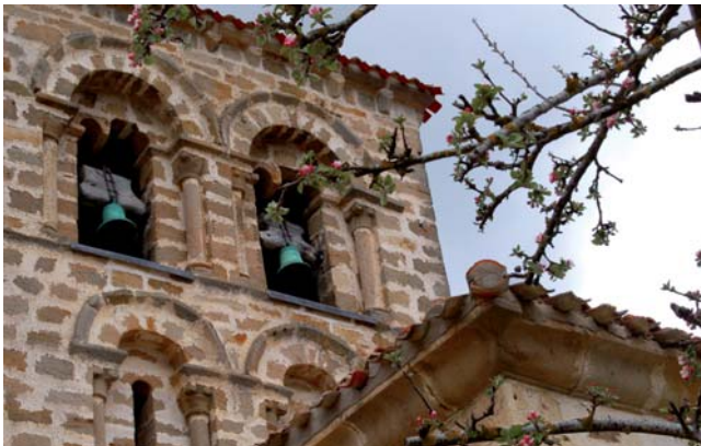
Iglesia de San Zadornil