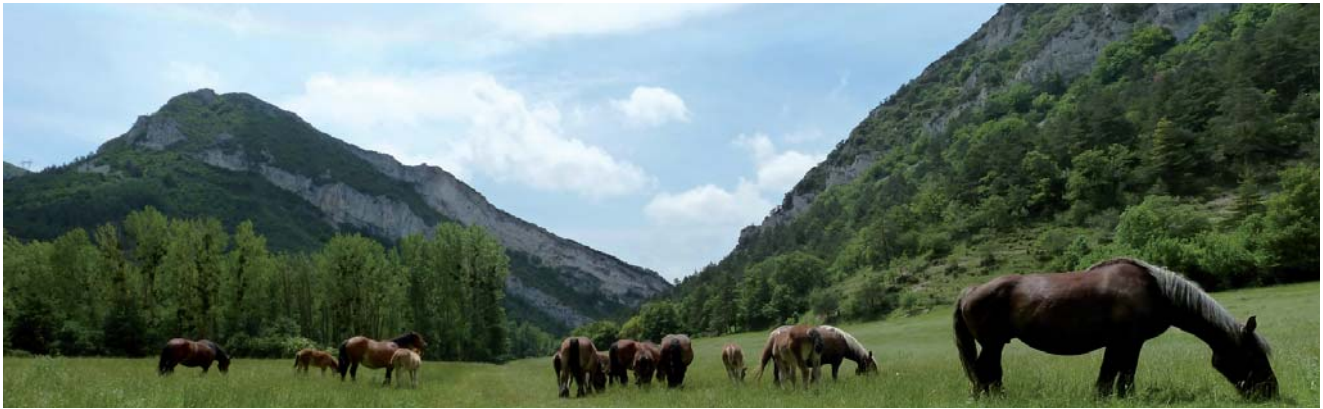
Caballos pastando en Valderejo