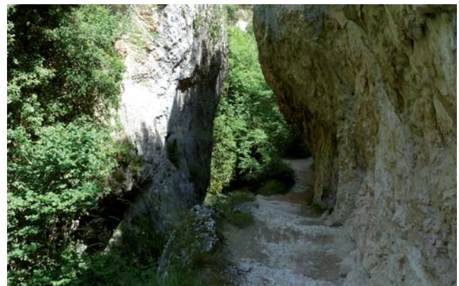
Desfiladero del Purón