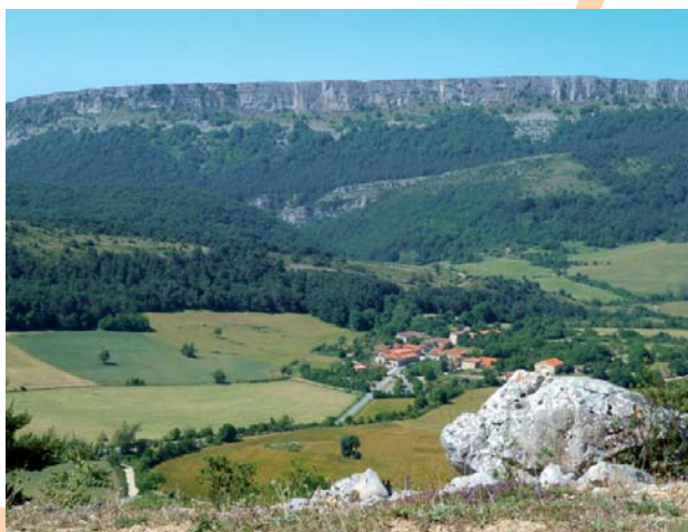
Lalastra y su entorno

2 [KM 6,4] LALASTRA. Esta pequeña y aislada localidad a la que se accede por la única carretera disponible, se encuentra perfectamente adecuada. Además de contar con la Casa del Parque y centro de interpretación e información.